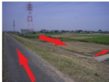
②土手を降り、直進する