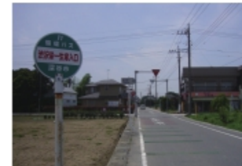
⑥バス停（渋沢栄一 生家入口）