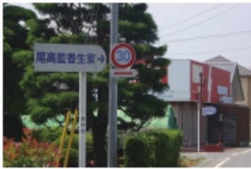
④尾高惇忠生家案内看板