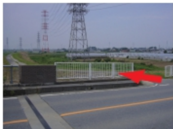
①端を渡り、左折し土手 を行く